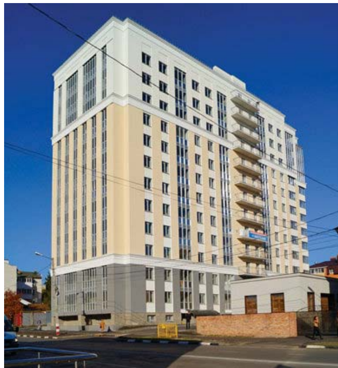
ЖК «Полет» на улице Орлова

Осенью 2018 года сдан ЖК «Полет» на улице Орлова. 12-этажный кирпичный дом с необычным фасадом и остеклением, причем возведен он не как большинство современных новостроек по технологии монолитного каркаса, облицованного кирпичом, а действительно как цельное кирпичное здание, что гарантирует тепло и тишину его будущим жильцам.