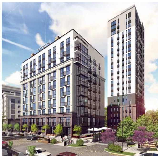
Жилой комплекс «Воробьевы горы»